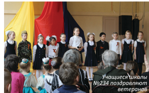
Учащиеся школы №234 поздравляют ветеранов

28 апреля ветеранов поздравили самые маленькие жители округа. Воспитанники детского сада № 48 подготовили не только концерт, но и вместе с ветеранами возложили цветы к памятнику Володе Ермаку.