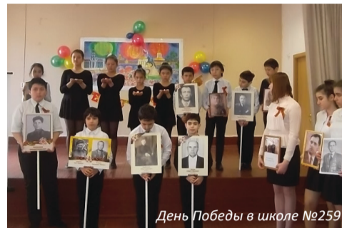
День Победы в школе №259

В праздничные дни учащиеся школ округа приглашали к себе ветеранов на торжественные встречи.