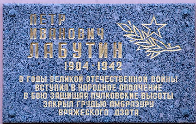
Мемориальная доска, ул. Лабутина, дом 2

Малая родина - это родной город, район, двор, то есть места, с которыми мы связаны эмоционально. Это школа и соседи, это любимые уголки - парки, аллеи, рожи, где человек чувствовал себя комфортно, где мечтал о будущем, где формировался как личность. В отличие от отвлеченного понятия об отечестве вообще, которое может формироваться с помощью литературных произведений, фильмов, народной культуры, он для каждого из нас ассоциируется с семьей, друзьями детства, любимыми уголками. В нашем родном историческом округе немало улиц переулков и проспектов, которые названы в честь знаменитых, достойных и великих людей. Одна из таких улиц носит имя героя Великой Отечественной войны Лабутина Петра Ивановича. Возможно, эта улица тоже чья-то малая родина. Накануне Дня памяти и скорби - 22 июня вспомним о герое.