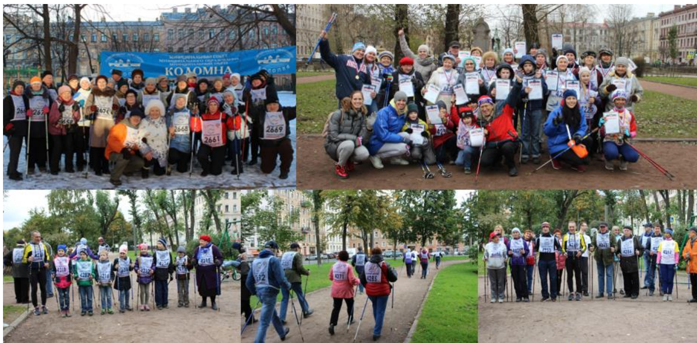
На фотографии участники спортивно-оздоровительных мероприятий по скандинавской ходьбе.