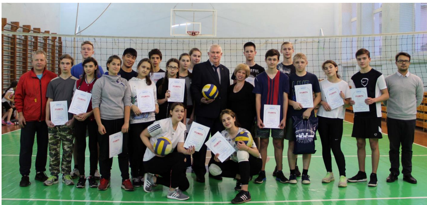
На фотографии участники волейбольного турнира.