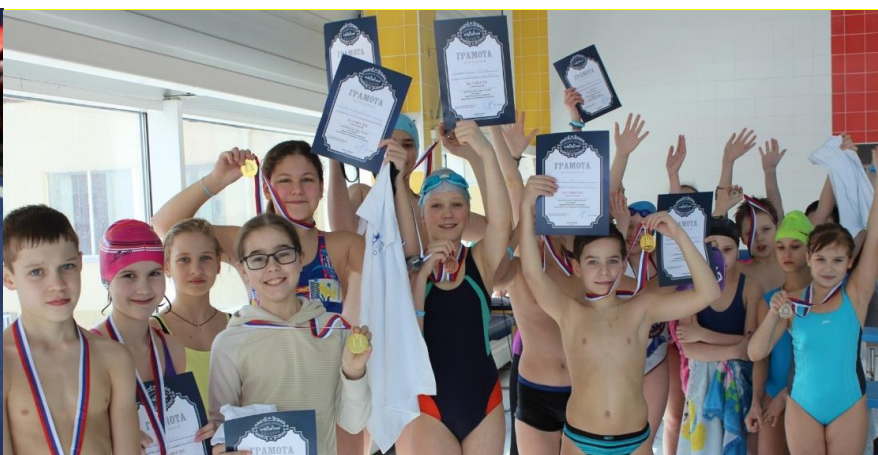
На фотографии участники спортивно-массового праздника на воде «Спорт в Коломне».