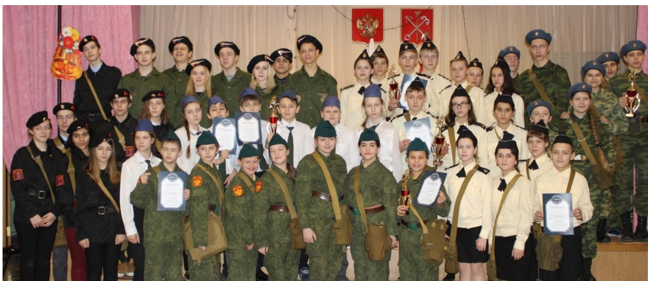
На фотографии участники муниципальных соревнований «Навстречу Победе!» среди школ округа.