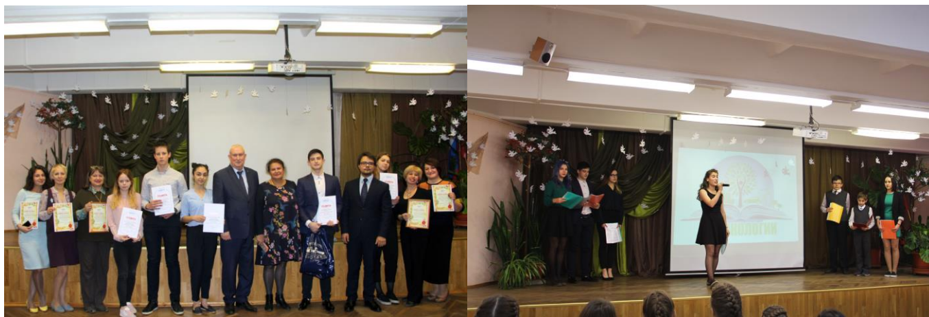
На фотографии участники конкурса экологических проектов.

Приняли участие в проведении конкурса экологических проектов на базе школы №260.