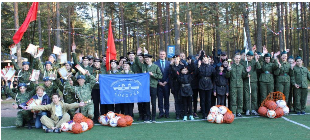
На фотографии участники районной «Зарницы», представляющие МО Коломна.

Был осуществлен выпуск и распространение брошюры по военно-патриотическому воспитанию «Я гражданин России» в количестве 1250 штук.