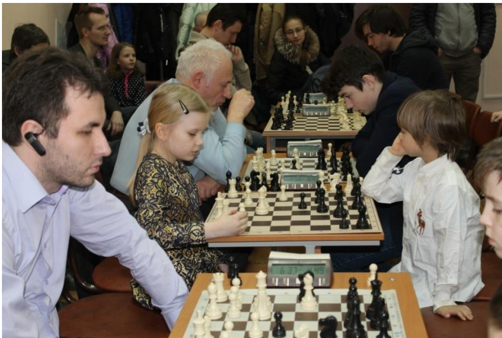
На фотографии участники муниципального шахматного турнира.