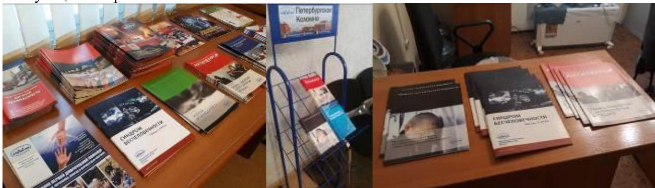
Брошюры по профилактике, которые распространяются среди жителей МО Коломна.

В течение года осуществлялось взаимодействие с органами государственной власти по соответствующим вопросам.