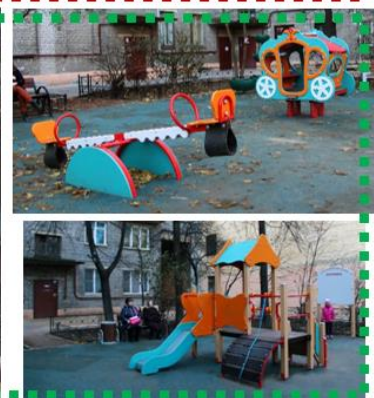
Новая детская площадка по адресу Писарева ул., д.10а