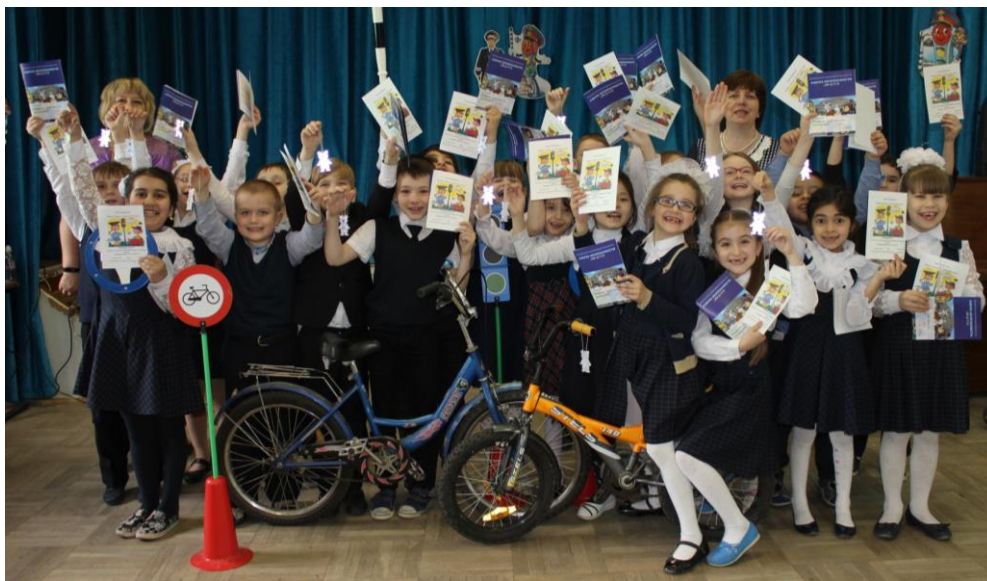
На фотографии интерактивный урок для первоклассников.

Изготовление и распространение печатной продукции брошюра «Правила дорожного движения (для детей)» и брошюры-раскраски «Правила дорожные совсем-совсем не сложные» общим тиражом 5500 штук.