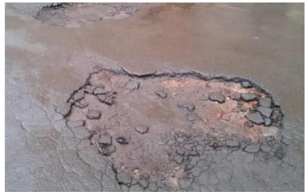
Псковская ул., д.20, д.22 и пр. Римского-Корсакова, д.101, д.103