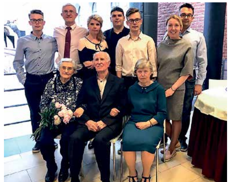
Большая семья Рупасовых-Ломако-Хейлик-Нургалеевых