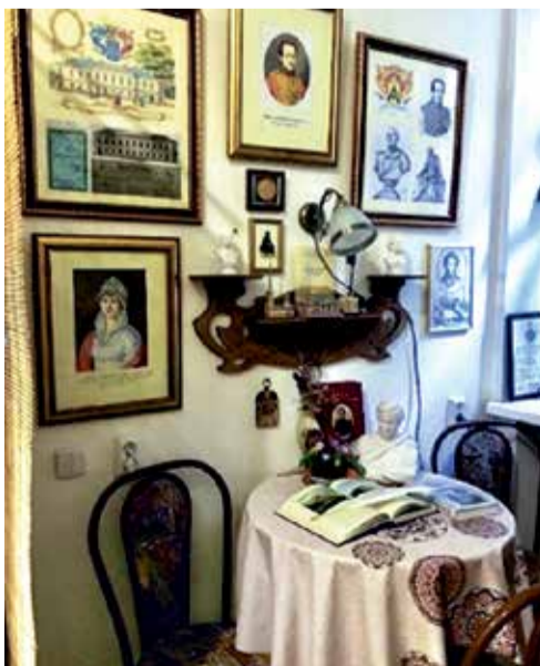
Фрагмент экспозиции «Лермонтовского кабинета» в квартире по адресу Лермонтовский пр. д.8а