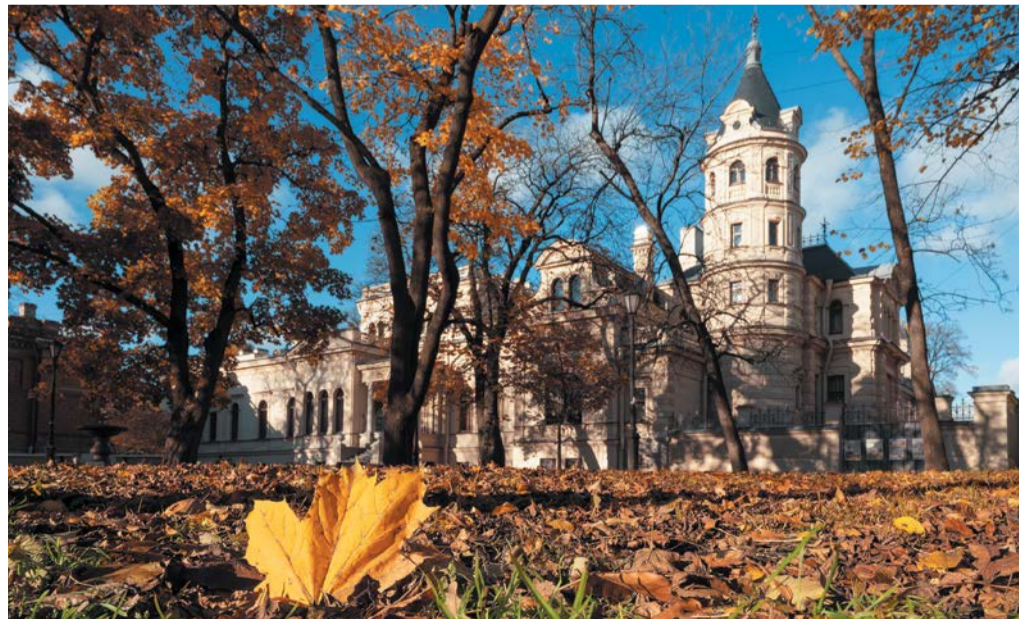
«Осень в Алексеевском саду». Козлович Иван