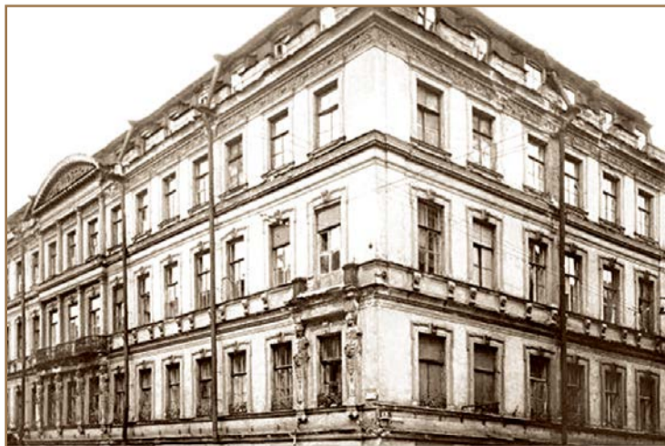
улица Офицерская, дом 17 (ул. Декабристов)

В 20-х годах «Новая петербургская проза» приняла деятельное участие в трансформации петербургского мифа. Метафора корабля (сменившая доминирующую прежде метафору всадника) была популярна в «новой петербургской прозе». Сам город казался огромным кораблем, сорвавшимся с якоря и вместе со своими отчаянными пассажирами, влекомым грозным, неуправляемым потоком к неизбежной гибели. Недаром у Мандельштама в эти годы родились апокалипсические строки: